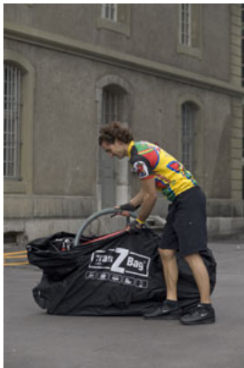
Vorderrad in der Innentasche unterbringen