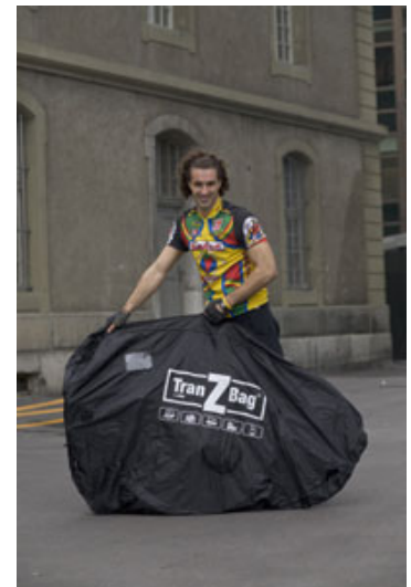
TranZBag ganz verschliessen