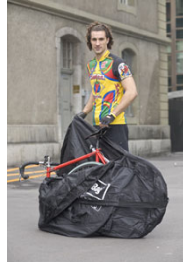
Reissverschluss über das Hinterrad nach vorne ziehen